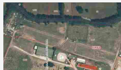
Appartamenti Altopascio loc. Carrari, Fraz. Marginone - 804093