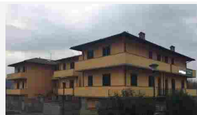
Appartamenti Gallicano Via Di Fondovalle snc - 88650