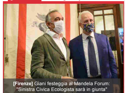
[Firenze] Giani festeggia al Mandela Forum: "Sinistra Civica Ecologista sarà in giunta"

Per la tua Pubblicità su: #gonews.it 0571 700931 commerciale@xmediagroup.it